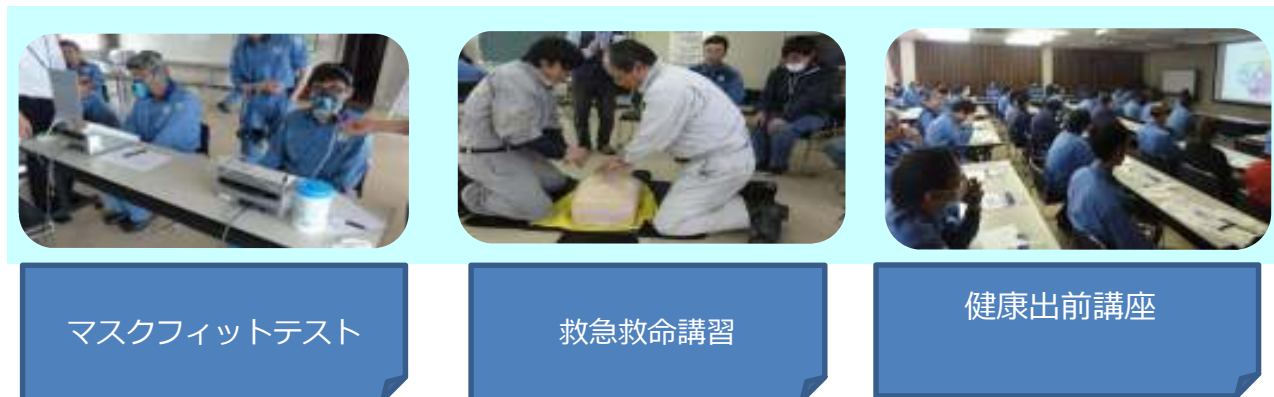
マスクフィットテスト